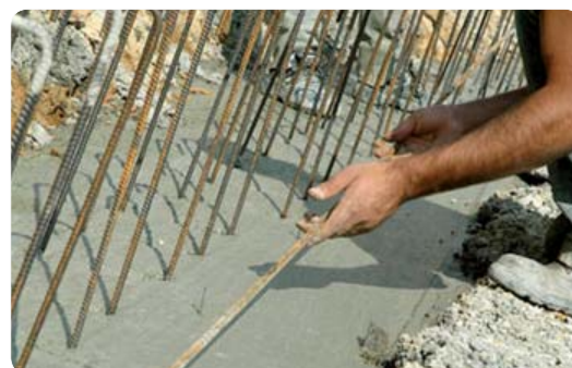
➔ L'emploi dans le BTP en recul sur Marseille en 2009

Fin 2009, 221 615 emplois salariés privés (données provisoires) étaient localisés à Marseille, soit une légère progression (+0,2%) par rapport à l'année précédente, correspondant à environ 450 emplois supplémentaires. Au niveau national, l'année 2009 se caractérise par des pertes d'emploi en nette accélération : -1,5% en 2009 contre -0,5% en 2008. L'emploi féminin connaît une progression relativement sensible à Marseille (+1,1%) alors