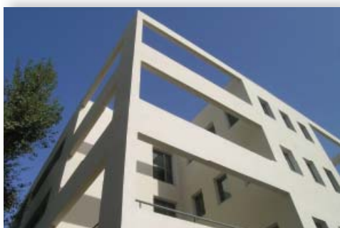
→ Espace Michaud - ZFU 14 e -15 e Sud