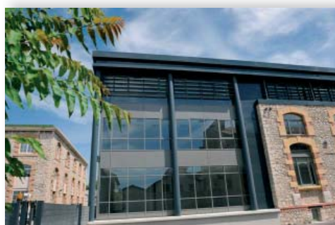
→ Carré Gabriel - ZFU 14 e -15 e Sud