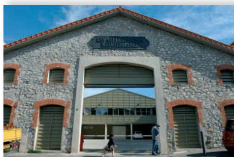
→ Ateliers de la Méditerranée - ZFU 14 e -15 e Sud