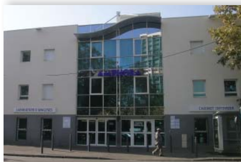
→ Amphora - Rond-point Sainte-Marthe ZFU 14 e -15 e Sud