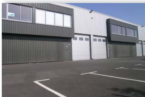
→ Altitude 180 - ZFU Nord Littoral