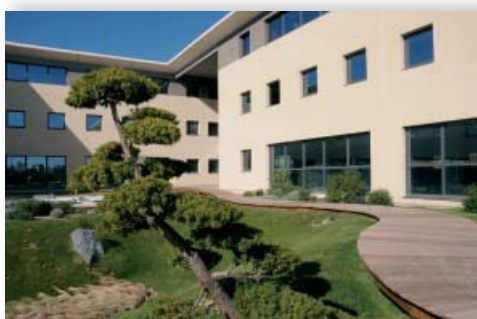
→ Cité de la Cosmétique - ZFU 14 e -15 e Sud