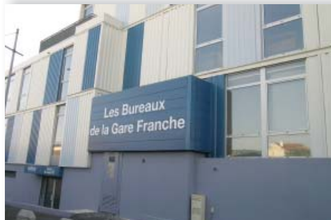
→ Bureaux de la Gare Franche - ZFU Nord Littoral