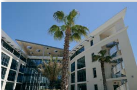
→ Plein Ouest - ZFU Nord Littoral