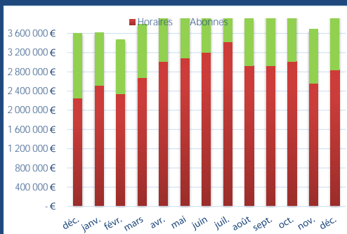
Recette par catégorie d'utilisateur