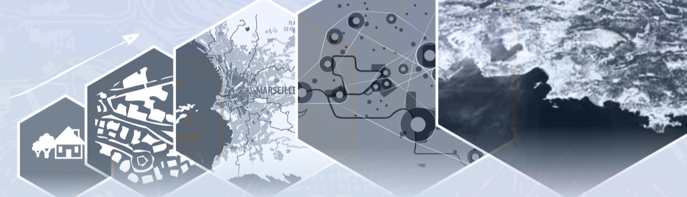
Du quartier au système métropolitain et à l'échelle régionale